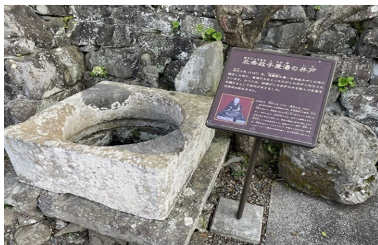
<北条政子産湯之井戸>

北条政子がこの地に誕生した時に、産湯の水をとったのがこの井戸と伝えられている。かつては妊婦がこの井戸の水を飲んで安産を祈願するという信仰があった。※現在は飲めません。