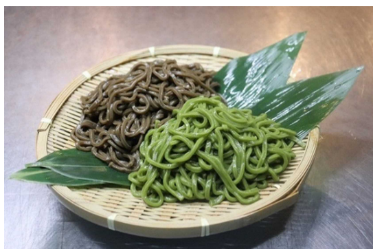
<お茶うどん(抹茶・ほうじ茶)>