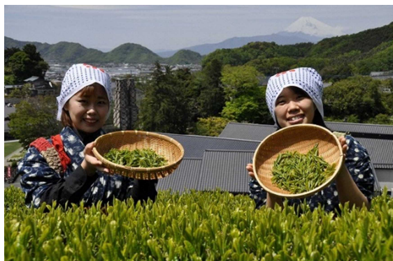
<チャレンジ茶摘み体験>